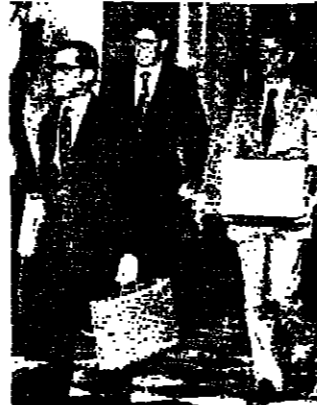
كولبي يتقدم للثمن من عمله في المخابرات الاميركية

كولبي يورط هيلمز والكليتهم كينسجر برمتها هي قضية تصفية حسابات تسلف كينسجر الذي كان يعطي التعليمات لوكالة المخابرات بصفتها رئيسا لمجلس الأمن القومي في عهد نيكسون.